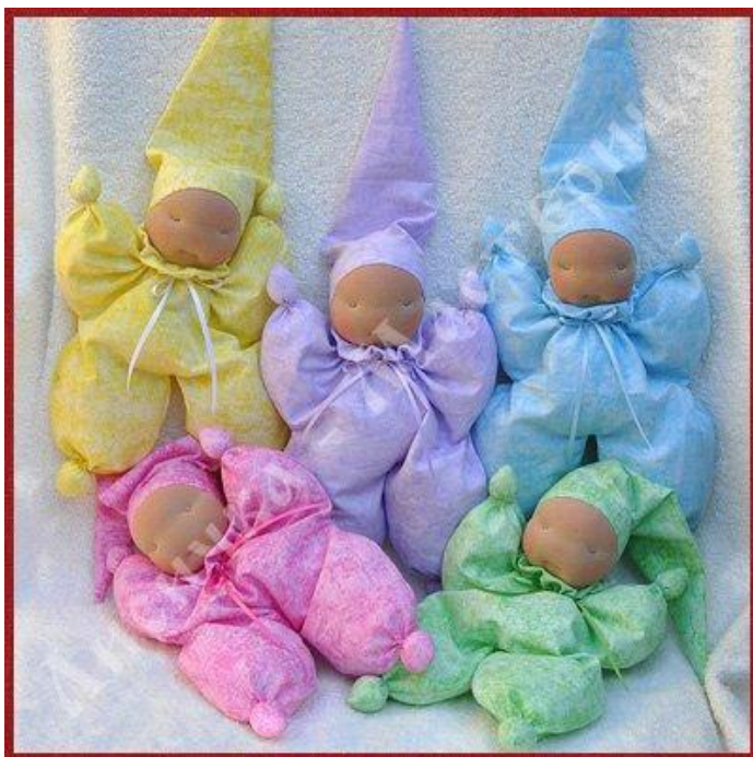
Современная интерпретация мини куколок

Во вторую группу входят игрушки, предназначенные для детей от 3 до 5-6 лет. Средние куклы очень разнообразны по форме, и вариантам изготовления, но они всегда сложнее, чем куклы для малышей. В зависимости от индивидуальных особенностей ребенка куклолка может быть полненькой или худенькой, с рельефными чертами лица, различной одеждой и украшениями. Тело куклы этой группы всегда пропорционально телу своего хозяина, может иметь выделенные кисти рук и стопы, выделенную