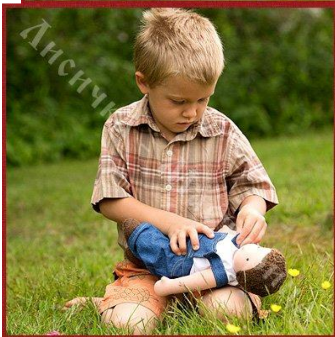
Мальчишки тоже играют в куклы