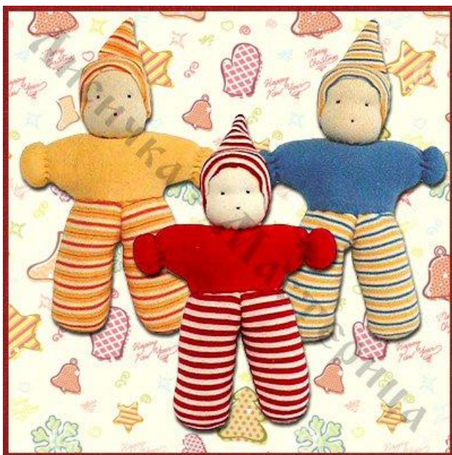
Классические Вальдорфские куколки малышки