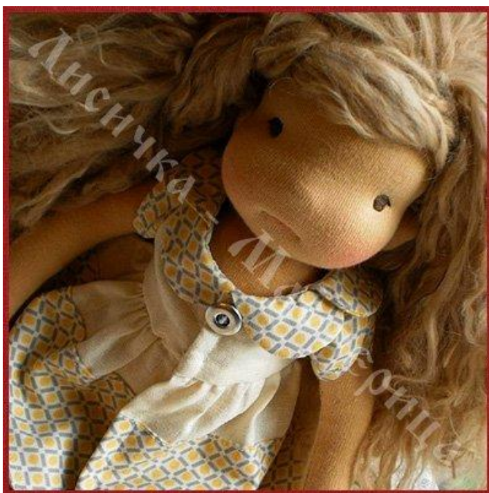
Вальдорфская кукла с богатой шевелюрой и сложными чертами лица

Каждая Вальдорфская кукла неповторима, как и ее обладатель, несмотря на то, что игрушки делаются по единому базовому принципу, выкройки в классической Штайнеровской школе не копируются, а создаются индивидуально, для каждой новой куклы. Пластичность и податливость, являются неотъемлемыми чертами Вальдорфских игрушек, развивая мелкую моторику ребенка, позволяя ему моделировать с помощью куклы физические