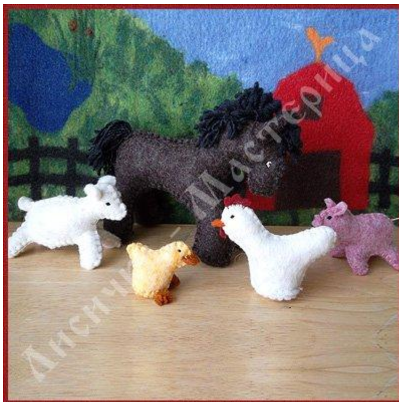
Обитатели самодельной Вальдорфской фермы

Каждая Вальдорфская кукла уникальна, поскольку создается для каждого конкретного ребенка в соответствии с его персональными особенностями, внешностью, характером и темпераментом. По мере роста ребенка, усложняется и создаваемая для него и с его участием кукла.