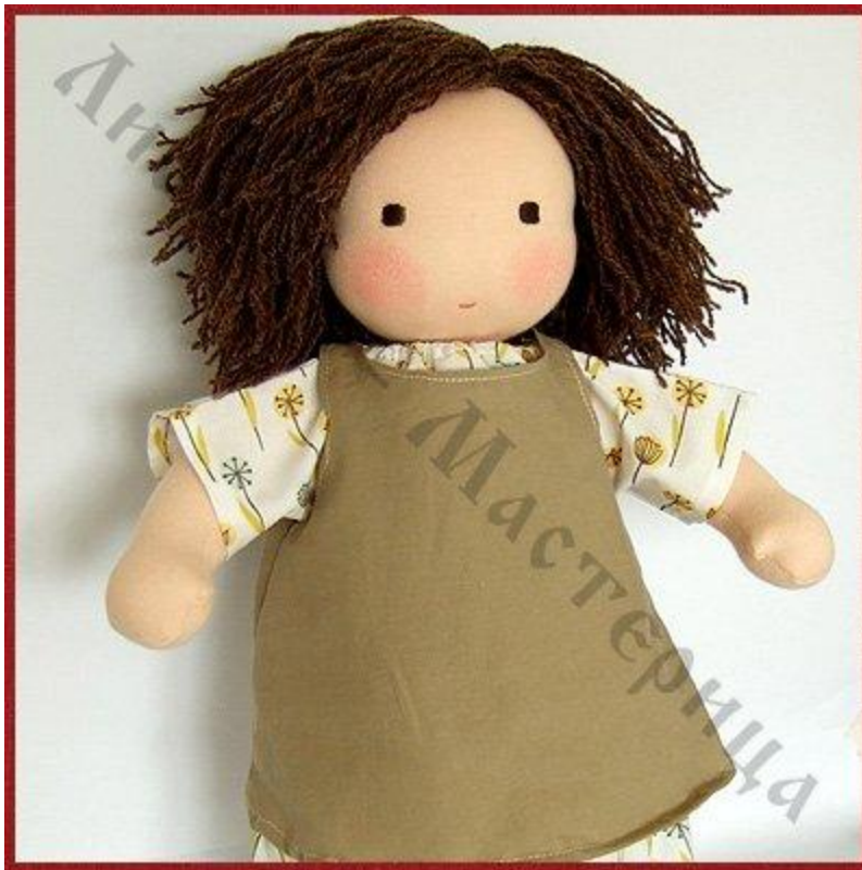
Мягкая игровая куколка