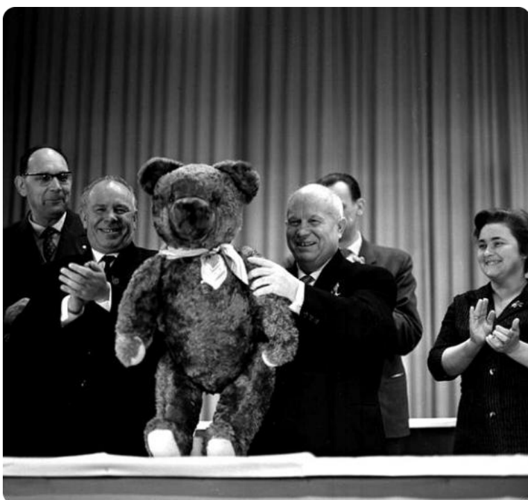
Мишка Тедди подарок лидеру СССР Никите Хрущеву (1963 г.)

Теодор Рузвельт не был против, так что прозвище Тедди быстро закрепилось за всеми плюшевыми медведями по всему миру.