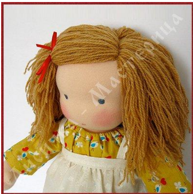
Вальдорфская кукла с русыми

недлинную шевелюру. Ребенок обычно принимает активное участие в создании своей куклы, выбирает основную модель, одежду и украшения, придумывает совместно с преподавателем имя и персональные особенности своей будущей игрушки. Зачастую ребенок ассоциирует создаваемую куклу с самим собой, что дает огромный материал педагогам для лучшего понимания мыслей и порывов ребенка. Вне зависимости от конкретной формы игрушки, она всегда создается наиболее удобной для игры, практичной и безопасной. Ребенок должен иметь возможность брать куклу с собой на прогулку, в постель, использовать во время совместных игр или в кукольном представлении.