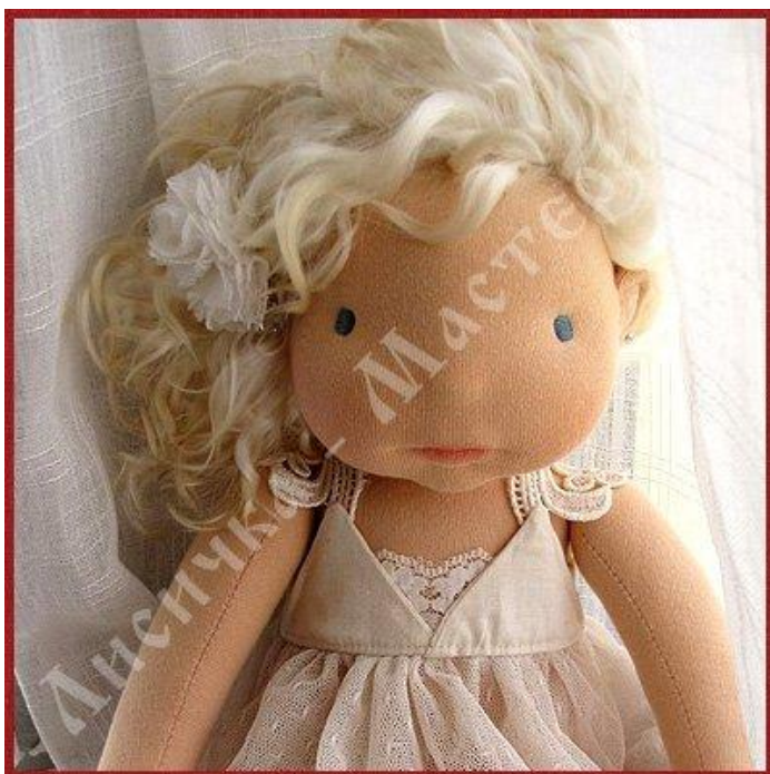
Кукла со сложными рельефными чертами лица, одетая в кружевное платье